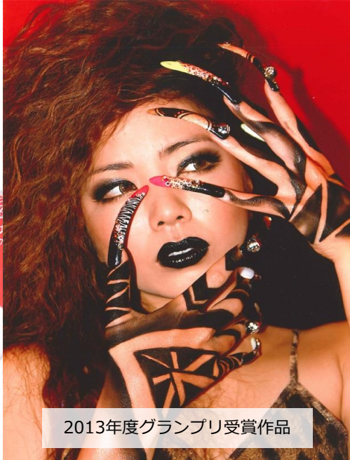
2013年度グランプリ受賞作品