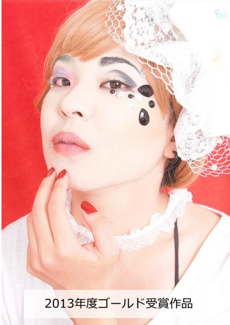
2013年度ゴールド受賞作品