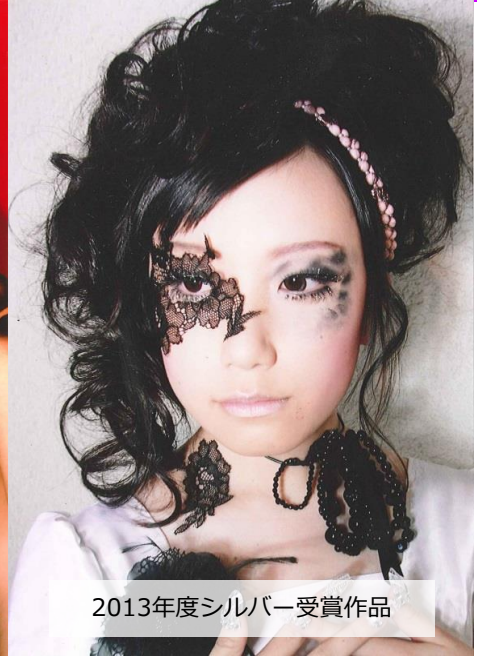
2013年度シルバー受賞作品