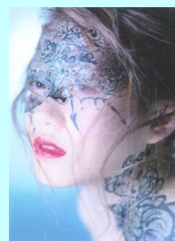
2015年度アーティスティックメイクアップ部門受賞作品