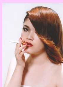
2015年度ビューティメイクアップ部門受賞作品