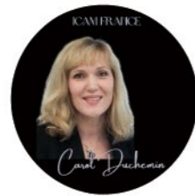
ICAM FRANCE 国際ライセンス試験制度委員長 キャロル・デュシュマン先生