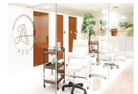
Produced by 専門学校 金沢美専 AER (アエル)